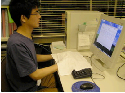
図 3: ハンカチによってキーボードを隠す

カチを配り、授業内外問わず、手の上からハンカチをかけてタイピング練習を行うように義務付ける(図 3)。